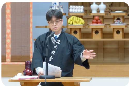
ご自身の歩みを心を込めて語られる講師