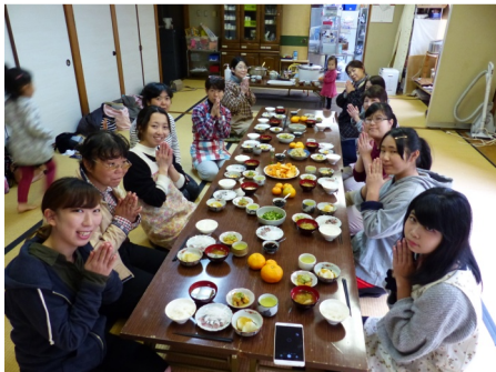
おいしくいただきました！