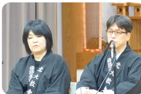
質疑応答にご夫妻でお答え頂く