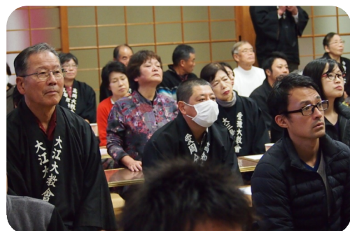
真剣に耳を傾ける参加者