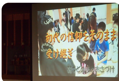
紹介ビデオの様子