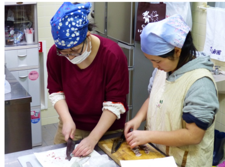
料理勉強会の様子