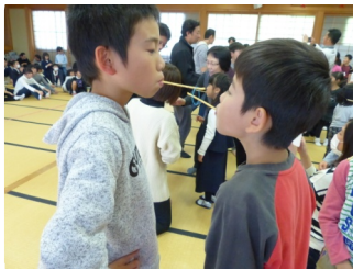
仲良く室内オリンピックを楽しむ様子