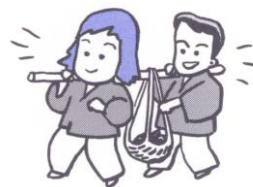
欲を忘れてひのきしん