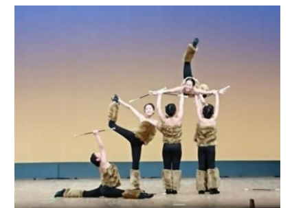
Aチーム「となりのトトロ」