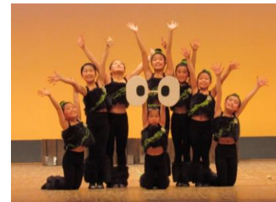
Bチーム「となりのトトロ～ススワタリ～」