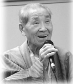
平成 28年 11月 27日 支部旅行にて