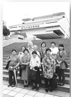
船橋支部 婦人会 移動例会 開催