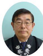
布教の家・ 総務部 担当主事