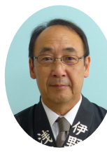
社会福祉部 担当主事