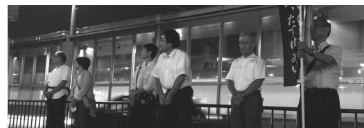
立教182年全教一斉にをいがけデー(9月28日~30日)