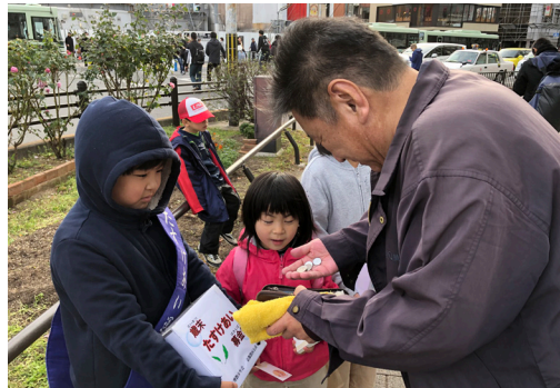
昨年の様子(2018年12月8日 阪急西院駅前)