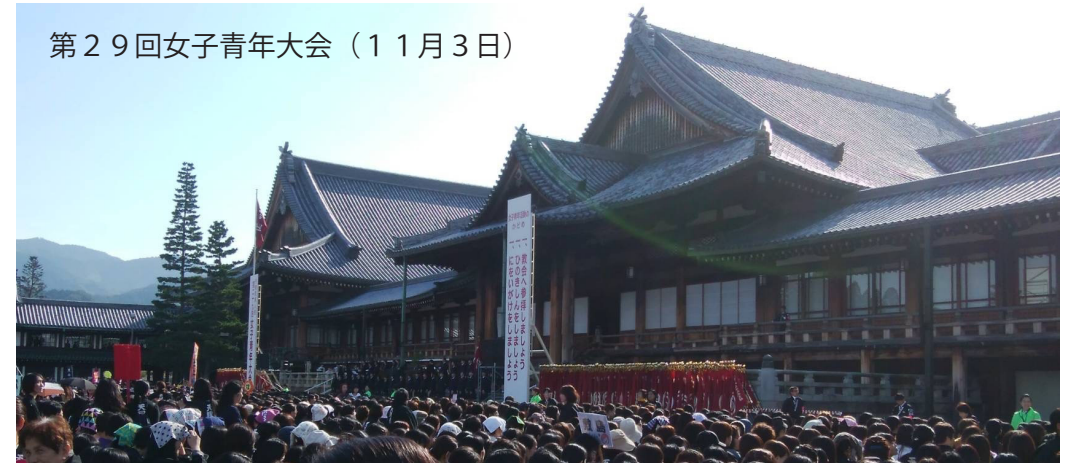
第29回女子青年大会(11月3日)