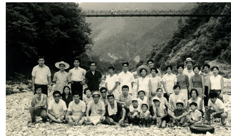
archives vol.3 右京支部青年会・女子青年親睦会(昭和44年夏 永源寺)

発行/天理教京都教区右京支部 〒616-8062 京都市右京区太秦安井春日町11-10