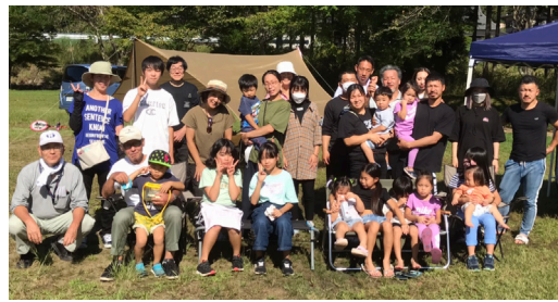
「右京支部デーキャンプ」(京北弓削川河川敷・9/25)