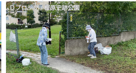
Dブロック/櫛原史跡公園