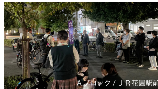
Aブロック/JR花園駅前

発行/天理教京都教区右京支部 〒616-8062 京都市右京区太秦安井春日町11-10