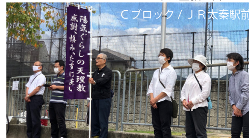
Cブロック/JR太秦駅前