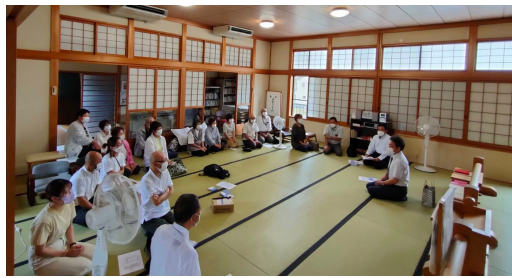
「全教一斉にをいがけデー / 桂坂方面」(金京分教会・9/29)