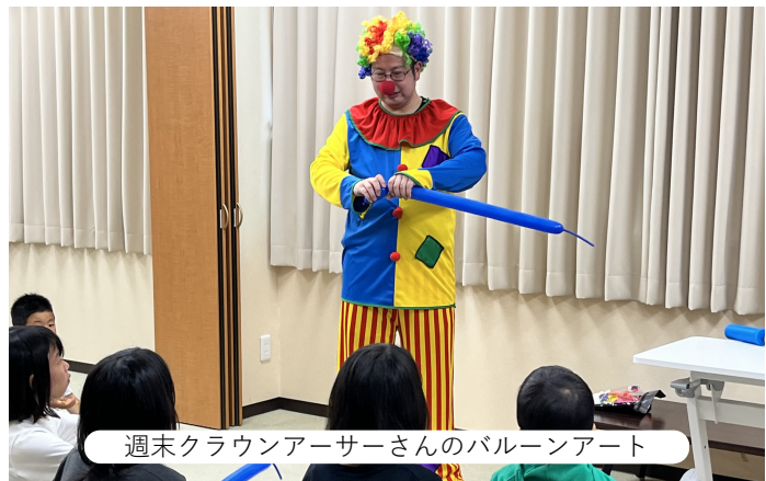
週末クラウンアーサーさんのバルーンアート