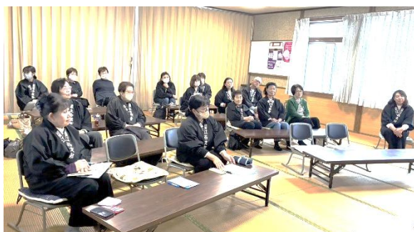
【栗東組】 びわこ学園野洲の ひのきしんパッチワーク作り 3 名