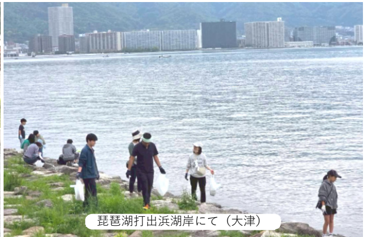
琵琶湖打出浜湖岸にて (大津)