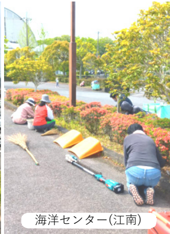
海洋センター(江南)