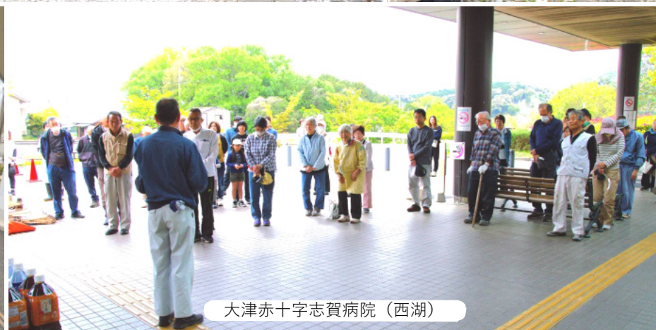
大津赤十字志賀病院(西湖)