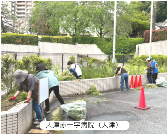
大津赤十字病院 (大津)