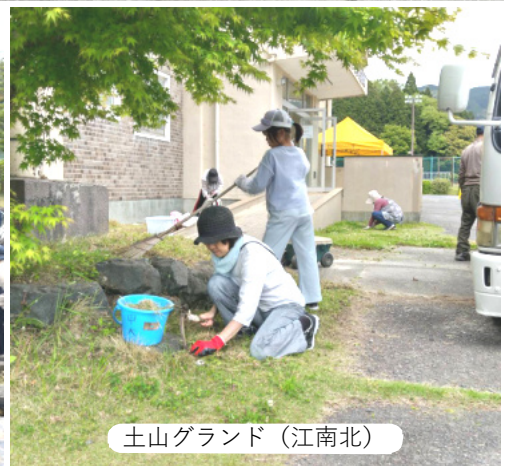
土山グラウンド (江南北)