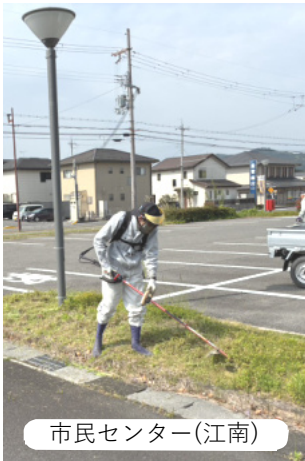
市民センター(江南)