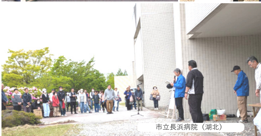
市立長浜病院(湖北)