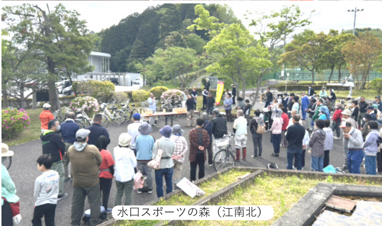
水口スポーツの森 (江南北)