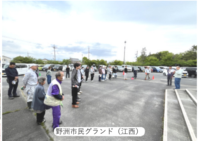
野洲市民グラウンド (江西)