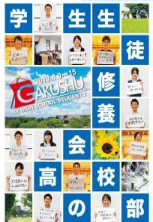
主催：天理教馬会本部・事務局 企画：東京学生教務委員会 実行：中野区学生教務委員会 協力：中野区教育委員会