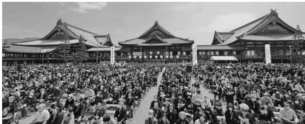
立教百八十六年教祖お誕生祭会場

支部でもいろいろ楽しく活動できる企画をして参りますので、宜しくご参加の程お願い致します