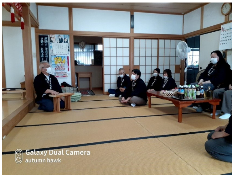
Galaxy Dual Camera autumn hawk