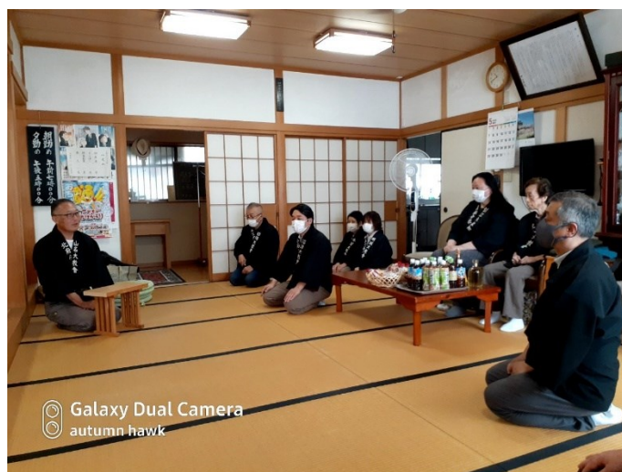
Galaxy Dual Camera autumn hawk