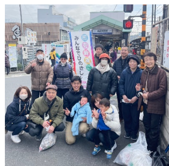
2/29 東上線東武練馬駅

★右上の QR コードを読み取り、『教区・支部情報ネット』から、支部活動案内・活動報告をご確認いただけます。また右の QR コードを読みとり、LINE の友達追加により、支部情報更新時にプッシュ通知が届きます。ぜひご活用ください。