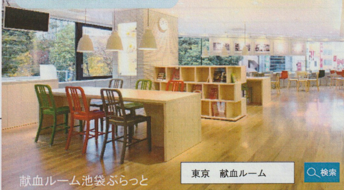
献血ルーム池袋ぶらっと