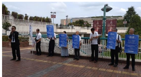
二十九日 石神井公園駅