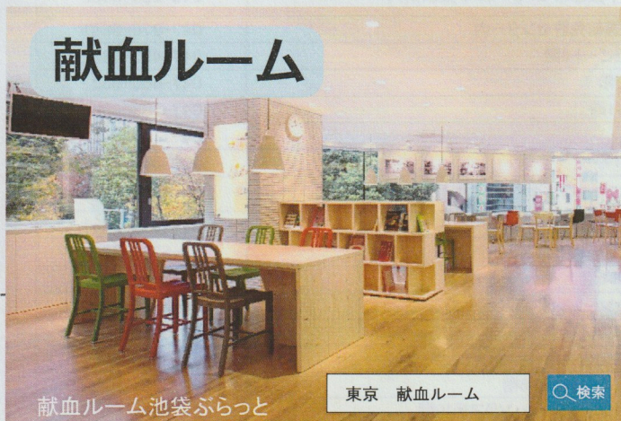
献血ルーム池袋ぶらっと