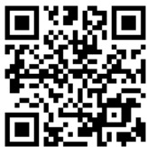
練馬支部情報ねっと