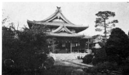
大正の教祖殿 (現祖霊殿)