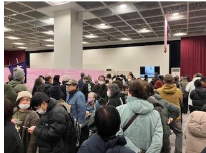
特別展示「おやさま」会場

この後もそれぞれの各会で一年を通じて年祭イベントが目白押しです いろいろ参加して十年分の旬の喜びを分かち合いましょう