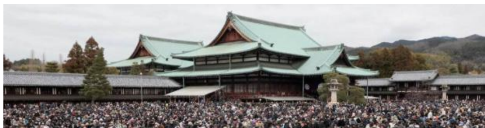
百四十年祭当日 教祖殿に向けて