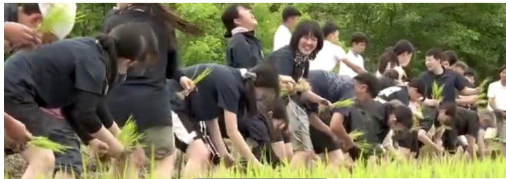
例年20日以降7月5日あたりで行われる 楽しい田植え風景

布留川のポイントでは多くのホテルが確認できます 月の終わりには杣之内で真柱様ご家族が学生とともに田植えする姿を 見ることが出来るかもしれません 多くの方の真実で作られたお米は「御供」等に用いられるそうです