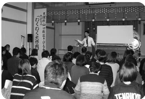
△福江先生による記念講演とその後のふりかえりの様子。